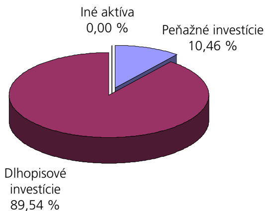
Podľa tried aktív